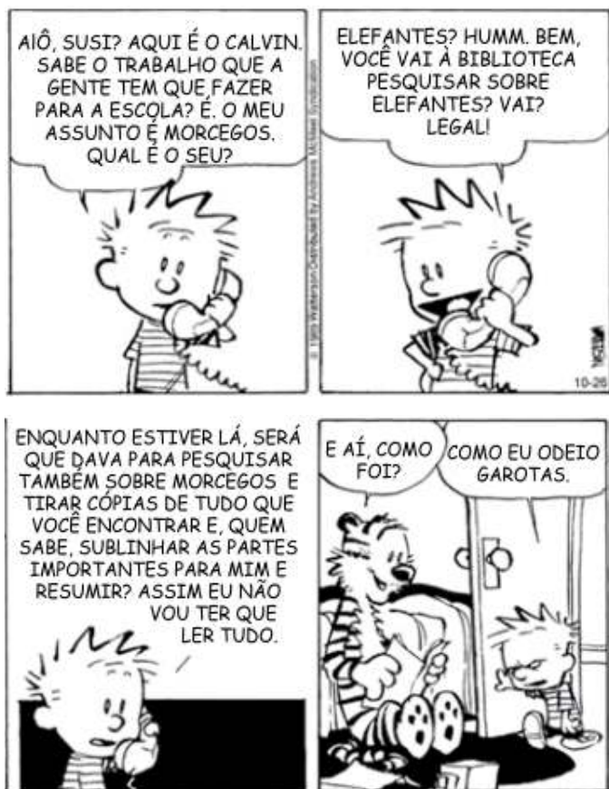
Bill Watterson. O melhor de Calvin, 26.10.2019. https://cultura.estadao.com.br

A atitude de Calvin nos três primeiros quadros revela: